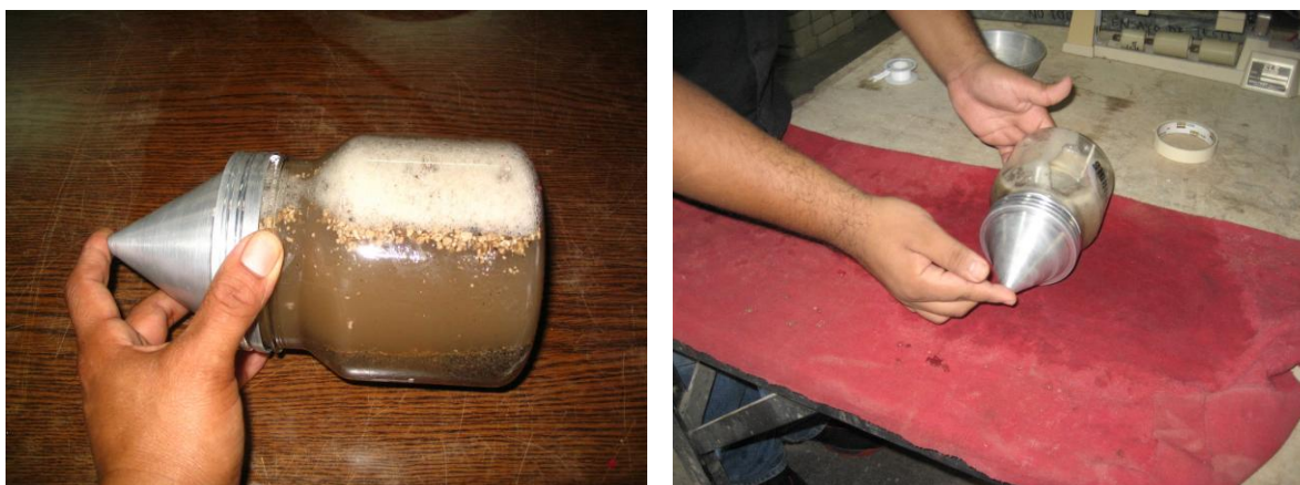
Figura 8 Desairado de la muestra a través del agitado manual.

a.1. Agitado manual , manualmente rueda, invierta y agite el picnómetro para eliminar todas las burbujas de aire, (ver figura 7). Normalmente se requiere de 15 a 20 minutos para eliminar las burbujas de aire por métodos manuales. Se ha encontrado que sumergir la esquina de una toalla de papel dentro del picnómetro es útil para dispersar la espuma que a veces se forma cuando se eliminan las burbujas de aire. Opcionalmente, puede ser usada una pequeña cantidad de alcohol isopropílico para dispersar la espuma.