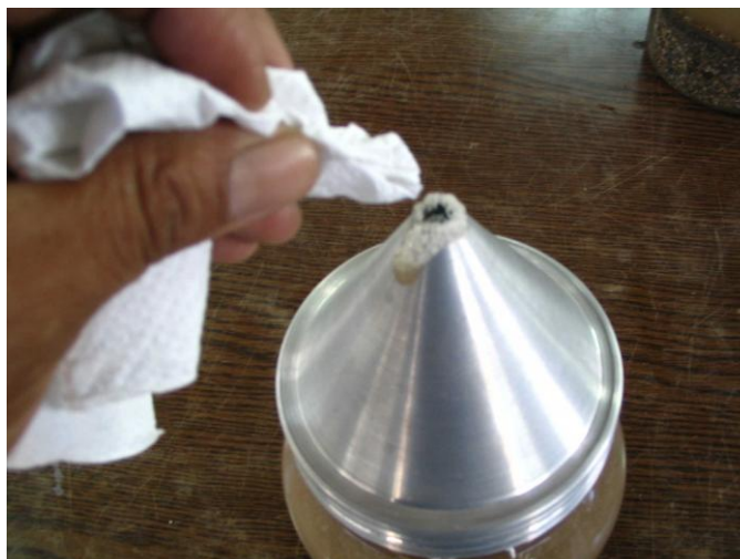
Fig. 9 Eliminado de burbujas.