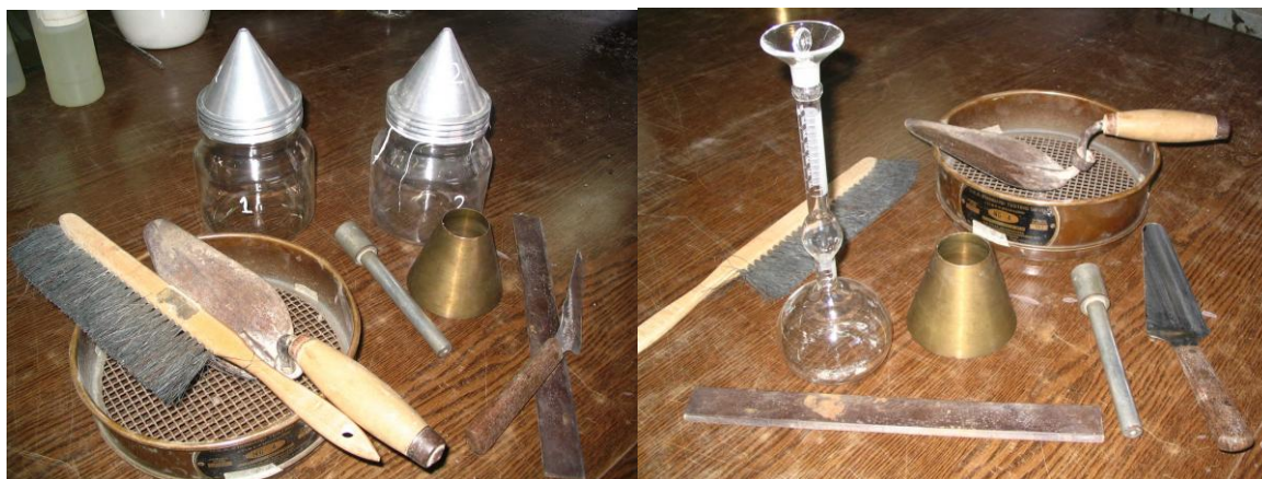
a) Procedimiento gravimétrico