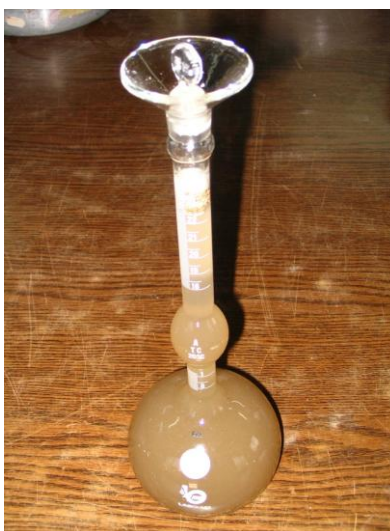
Fig. 10 Lectura de Frasco Le Chatelier con muestra y agua desairadas.