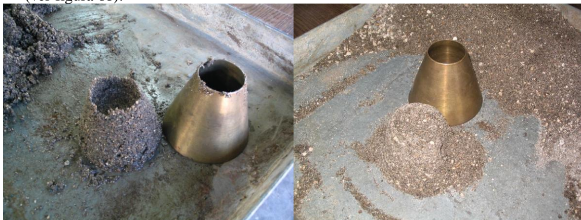
a) arena en condición saturada

Sujete el molde firmemente sobre una superficie lisa y no absorbente con el diámetro mayor hacia abajo. Coloque una porción de agregado fino parcialmente seco y suelto dentro del molde, llenándolo hasta que se desborde y apilando el material adicional por encima del borde superior del molde, sosteniéndolo con los dedos. Ligeramente apisone el agregado fino dentro del molde con 25 golpes ligeros del pisón. Inicie cada caída 5 mm arriba de la superficie del agregado fino. Permita al pisón caer libremente bajo la atracción gravitacional en cada caída. Ajuste la altura inicial a la elevación de la nueva superficie después de cada golpe y distribuya los golpes sobre la superficie. Remueva la arena suelta de la base y levante el molde verticalmente. Si la humedad superficial está aún presente, el agregado fino retendrá la forma del molde. Un desplome ligero del agregado moldeado indica que este ha alcanzado una condición de superficialmente seco, (ver figura 6b).