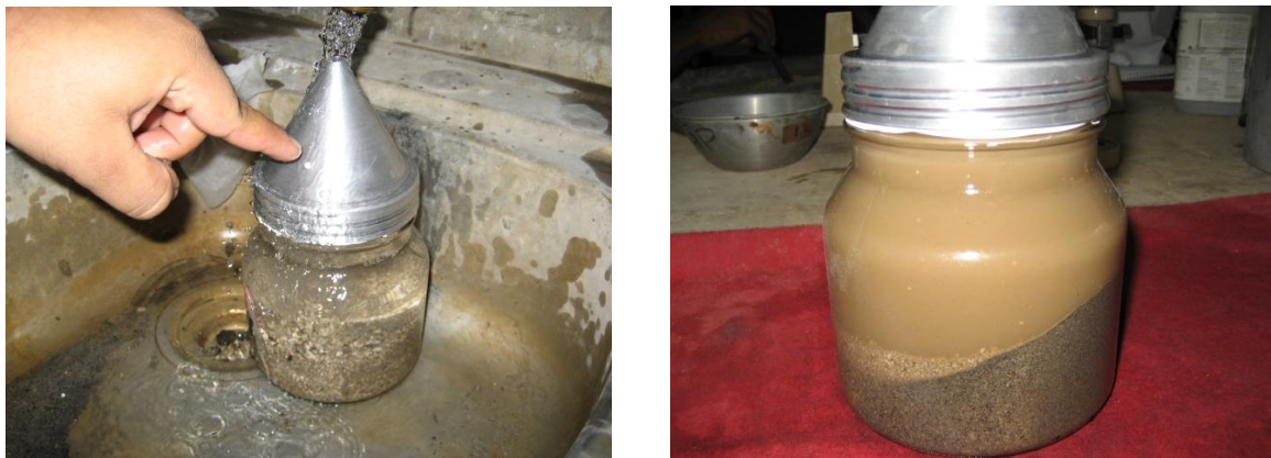
Figura 7 Picnómetro mas arena mas agua

a.1. Agitado manual , manualmente rueda, invierta y agite el picnómetro para eliminar todas las burbujas de aire, (ver figura 7). Normalmente se requiere de 15 a 20 minutos para eliminar las burbujas de aire por métodos manuales. Se ha encontrado que sumergir la esquina de una toalla de papel dentro del picnómetro es útil para dispersar la espuma que a veces se forma cuando se eliminan las burbujas de aire. Opcionalmente, puede ser usada una pequeña cantidad de alcohol isopropílico para dispersar la espuma.