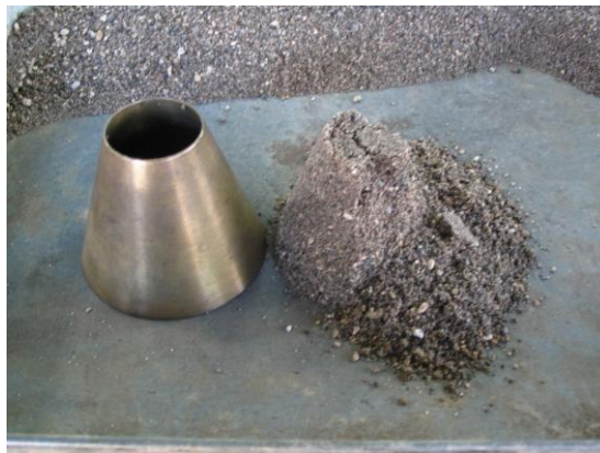
c) arena en condición seca