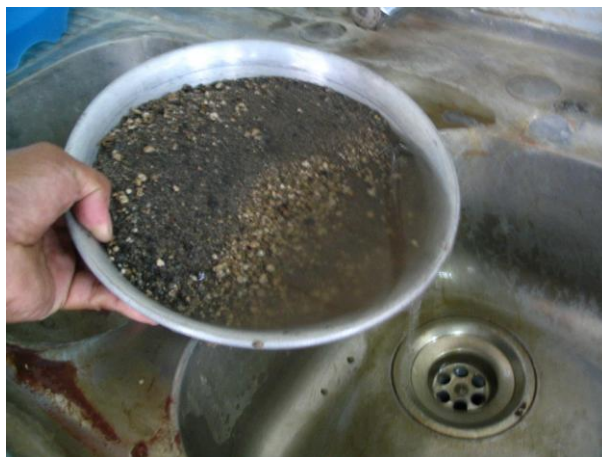
Figura 5 Decantado de la muestra.