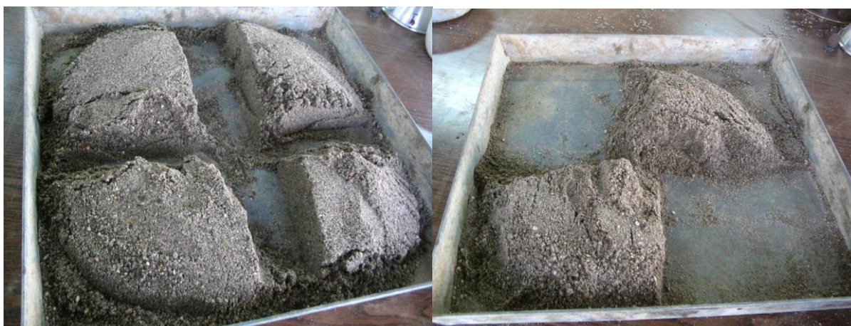
Fig. 3 Muestreo de la arena a ensayar.

Muestree el agregado de acuerdo con la Práctica D 75, ver figura 3. Mezcle completamente la muestra y redúzcala para obtener un espécimen de ensayo de aproximadamente 1 kg, usando el procedimiento aplicable descrito en la Práctica C 702.