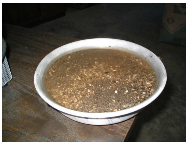
Figura 4 Muestra en proceso de saturación.

Seque el espécimen de ensayo en un recipiente adecuado o vasija, a masa constante a una temperatura de 110 \pm 5 °C. Permítale enfriar a una temperatura de manejo confortable, cubra con agua ya sea por inmersión o por adición de al menos 6% de humedad del agregado fino y permita reposar por 24 \pm 4 horas, (ver figura 4). Donde los valores de la absorción y la densidad relativa (gravedad específica) son para usarse en proporcionamiento de mezclas de concreto en los cuales el agregado estará en su condición de humedad natural, el requerimiento para secado inicial es opcional, y si la superficie de las partículas en la muestra han sido mantenidas continuamente húmedas hasta que sean ensayadas, el requerimiento para 24 \pm 4 horas también es opcional.